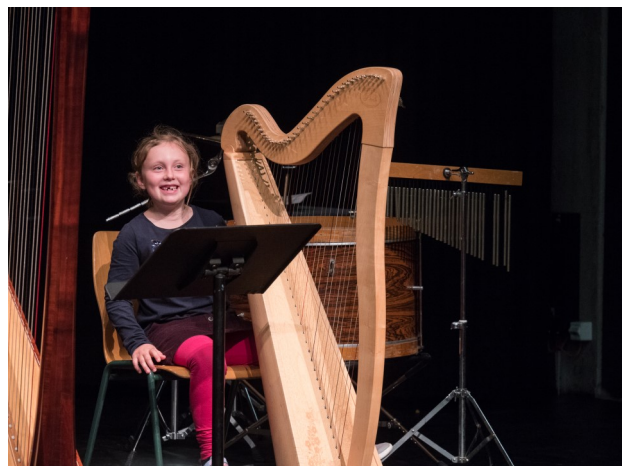
Musikschule Glarus, Stufentest- Konzert