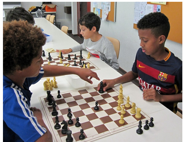
Glarner Schachclub, Jugendschachtreff