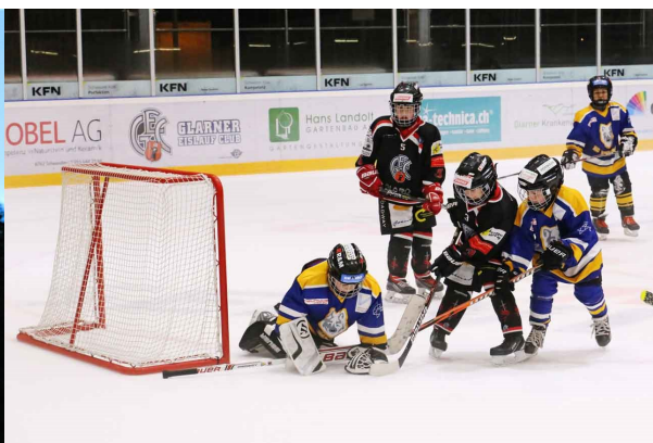
Glarner Eislaufclub, „Bambini Rappers“